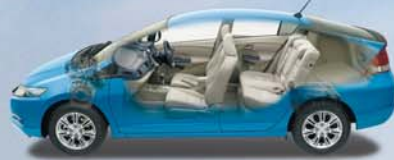
Photo: Insight L ボディカラーはブリリアントスクイークメタリック インテリアカラーはウォームグレー メーカーオプション(Honda HDDインターナビシステム、ETC搭載) * 15インチアルミホイールセットで31.2万円(税別) さまざまなクルマの開発で育まれたHondaならではのパッケージング技術。 そのアイデアやテクノロジーは、もちろんインサイトにも活かされています。 Hondaハイブリッドシステムをはじめ、メカ的小型化を徹底。 さらにそのレイアウトにも、工夫を凝らして最適なパッケージングを追求。 扱いやすいナンバーサイズのボディに、ゆとり快適な室内、 たっぷりの荷室など、毎日に使える機能を凝縮しています。